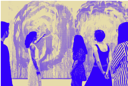
FOKUS AUF KÜNSTLER:INNEN UND KREATIVPROJEKTE MIT BEZUG ZUR SAMMLUNG BRANDHORST