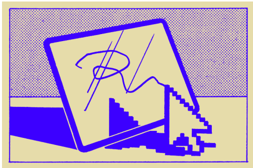
INDIVIDUELLE PLANUNG UND FOKUSWAHL JE NACH ZEITLICHEN RESSOURCEN, LEHRPLANBEZUG UND KLASSENSTUFE